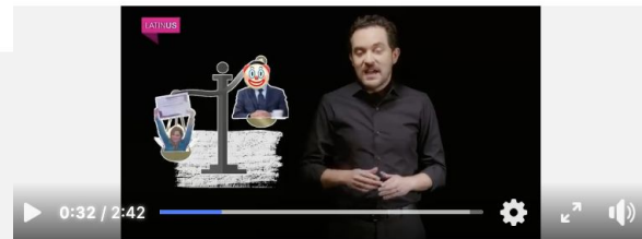
Perfiles 2024: Claudia Delgadillo

#Perfiles2024. Hoy, Claudia Delgadillo, candidata a la gubernatura de Jalisco con Morena y aliados. La expriista es señalada de tener vínculos con el fraude más grande en la historia del estado. #Latinus #InformaciónParaTi