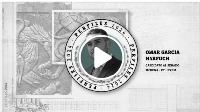
Perfiles 2024: Omar García Harfuch

#Perfiles2024. Hoy, Omar García Harfuch, candidato al Senado con Morena y aliados. El superpoliciá de Claudia Sheinbaum que perdió la candidatura en la Ciudad de México. #Latinus #InformaciónParaTI