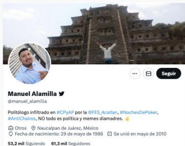
Manuel Alamilla @manuel_alamilla