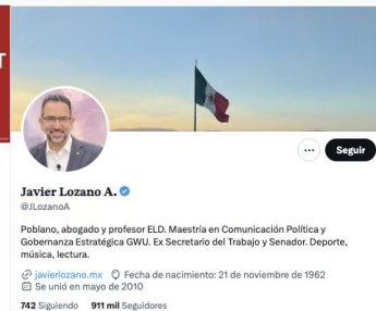
Javier Lozano @jlozanoA