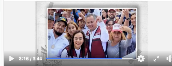
Perfiles 2024: Santiago Nieto

#Perfiles2024. Hoy, Santiago Nieto. Su candidatura al Senado con Morena está en el limbo. El polémico extitular de la UIF que perdió el puesto por casarse en una lujosa boda. #Latinus #InformaciónParaTI