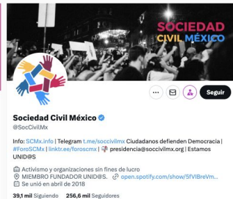
Soc. Civil México @soccivilmx