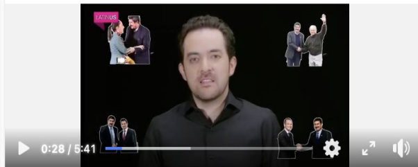
Perfiles 2024: Javier Corral

#Perfiles2024. Hoy, Javier Corral, candidato al Senado con Morena y aliados. El expansionista que era crítico y ya está en una luna de miel con López Obrador. #Latinus #InformaciónParaTI