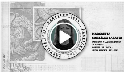
Perfiles 2024: Margarita González Saravia

#Perfiles2024. Hoy, Margarita González Saravia, candidata a la gubernatura de Morelos con Morena y aliados. Estuvo a cargo de la polémica rifa del avión presidencial. #Latinus #InformaciónParaTi