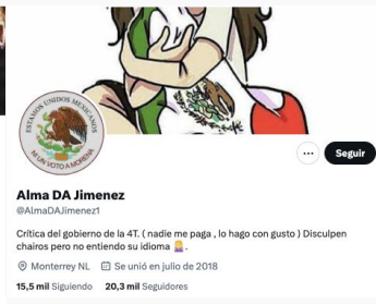
Alma Da Jiménez @almadajimenez1