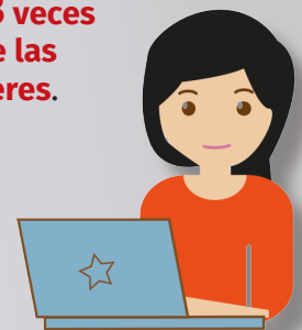
Gráfica 1. Índice de la Tendencia Laboral de la Pobreza